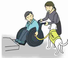
乗り越えられない段差の介助