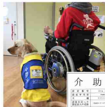
(左)介助犬とユーザー (右)介助犬の表示