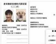
(左上)身体障害者補助犬認定証