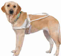
ハーネスを着けた盲導犬