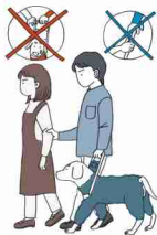
不慣れた場所への誘導

お困りの様子が見られたらユーザー本人に「何かお手伝いしましょうか」「どのようにお手伝いすればよろしいですか」などの声かけや筆談でコミュニケーションをとりましょう。