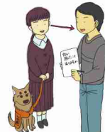
館内放送や電車内のアナウンスの伝達