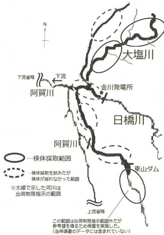
図1 日橋川いわな検査位置