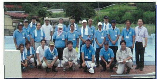
伊達市学校の除染メンバー: 絆プロジェクト