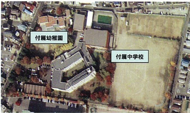
除染前後の線量率の比較