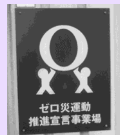
ゼロ災運動推進宣言事業場の証