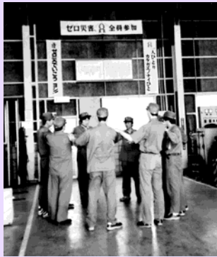
「タッチ・アンド・コール」の風景