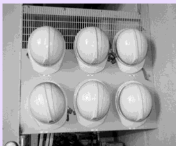
ヘルメットの整理整頓も徹底