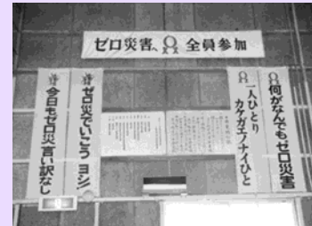
「ゼロ災」の文字を至る所に掲示