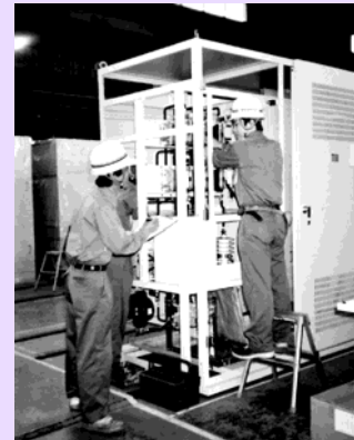
「問いかけ」により作業に潜む危険を抽出