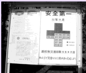
無災害日数は 5,500 日超に