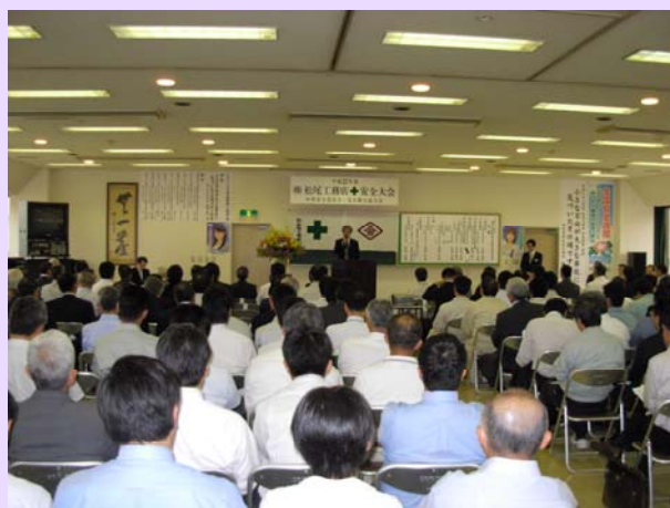
本社安全大会の様様