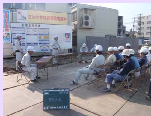
本社安全大会前に「現場安全大会」を開催。安全コールで無災害を誓う