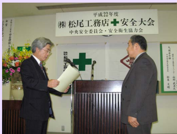
優良な協力会社や個人の安全表彰などを行う