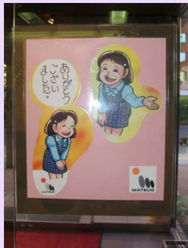
さわやか挨拶運動の ポスター。本社正面 玄関にも掲示