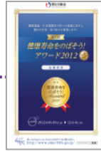
アワード パンフレット 作成・配布