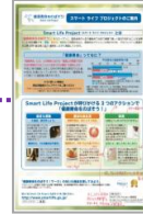
生活者向けパンフレットアワード受賞事例 作成・配布