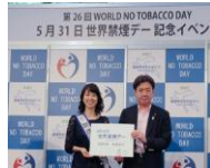
世界禁煙 デーイベント (5/31)