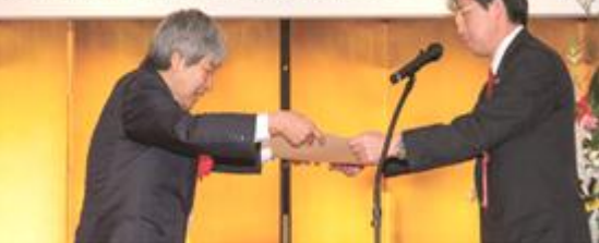
<静岡県に厚生労働大臣最優秀省を授与>