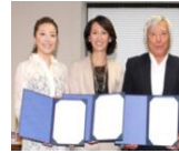
いきいき健康 大使任命式 (9/16)