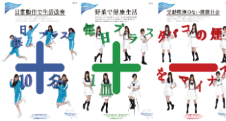
健康普及月間 ポスター 作成・配布