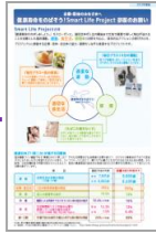
企業向け パンフレット 作成・配布