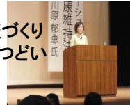
第9回 健康づくり 佐久市民のつどい (10/19)