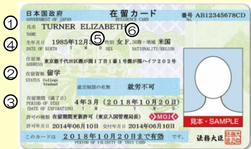
在留カード例（表面）