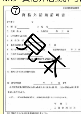
※3 資格外活動許可書