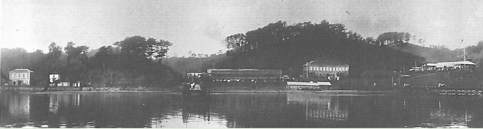
設置された頃の横浜検疫所(明治28年頃撮影)