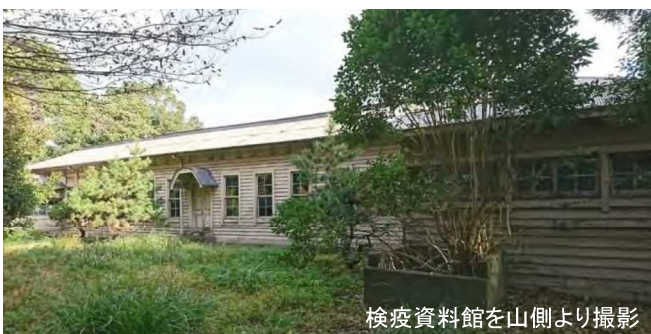
検疫資料館を山側より撮影

お問い合わせ先:横浜検疫所総務課 横浜市中央区海岸通1-1 (横浜第二港湾合同庁舎) TEL 045-201-4458 / Fax 045-201-3302