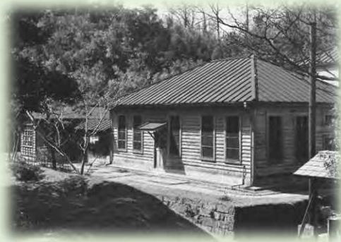
野口英世が細菌検査に従事した 細菌検査室