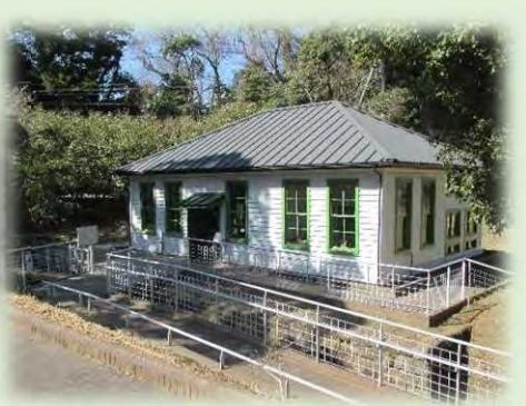
平成9年(1997年)5月にオープンした野口記念公園内に復元された細菌検査室