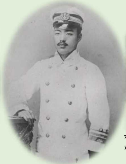
検疫医官補時代の野口英世