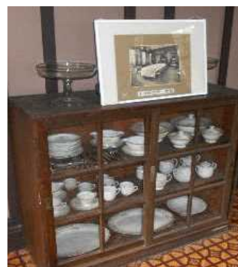
【当時使用していた食器類】