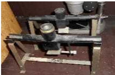
【検疫に使用した検査機器】