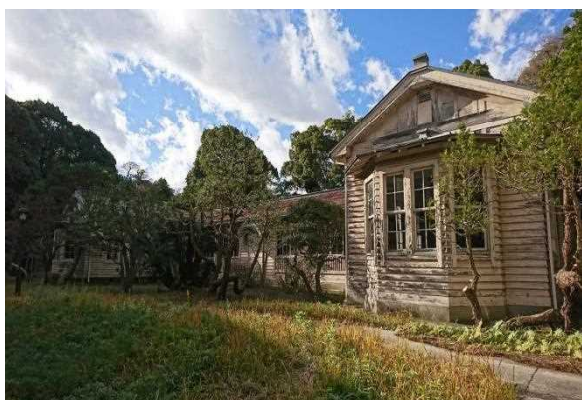
【外観(海側より撮影)】