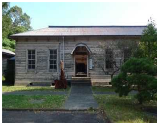
【外観(西側より撮影)】