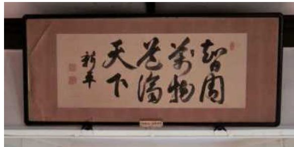
【（伝）後藤新平の直筆の書】

※「薬学（医）の道は、智のとびらを開く世の中の人を守る筋道である」と解釈される。