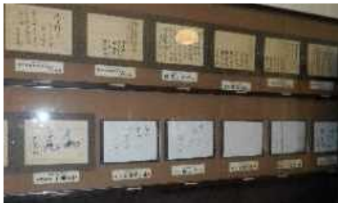
【来所した著名人の短歌等】