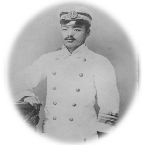
検疫医官補時代の野口英世