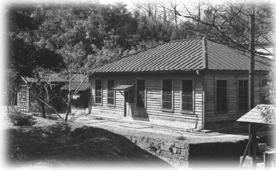
【野口英世が細菌検査に 従事した細菌検査室】