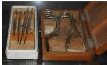
【感染症患者等への診察器具】