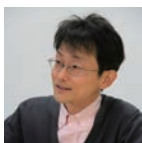
福島県立医科大学 災害医療総合学習センター 副センター長