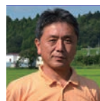
農業法人でんばた 取締役

現在は、福島県立医科大学での医療対応に加え、学生・医療者への被ばく医療に関する教育、住民の個別健康相談や講演会・座談会・勉強会などを通して、福島の今を住民と見つめる取り組みを進めている。