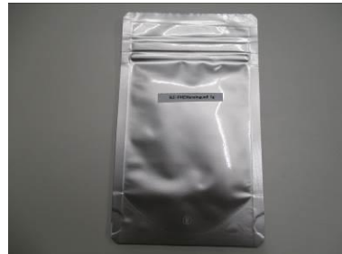
(2) BZ-PHEN analogue6