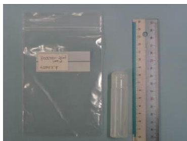
(3) Booster ver.2