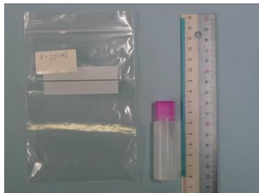
(1) \gamma -spiral