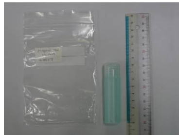
(2) \gamma -spiral ver.mint