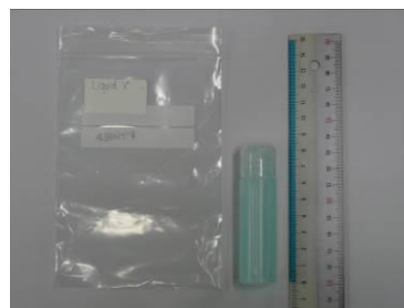
(4) Liquid X