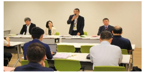
↑ 3市村と受託者による成年後見に関わる専門職及び報道機関向けの説明会