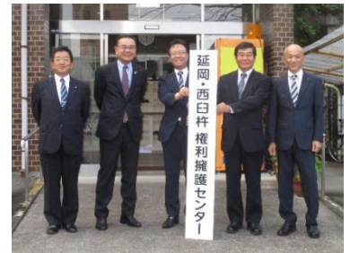
↑4市町首長（一部代理）と受託者代表者による看板披露