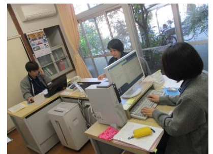
↑中核機関の業務風景

今後も、各地の取り組みの状況を、ぜひお知らせください。本ニュースレターでご紹介していきます！！