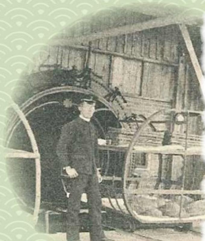
明治28年完成当時の第一消毒罐

わたしたちは検疫により、日本に常在しない感染症の流入を防ぎ国民の健康を守ります。