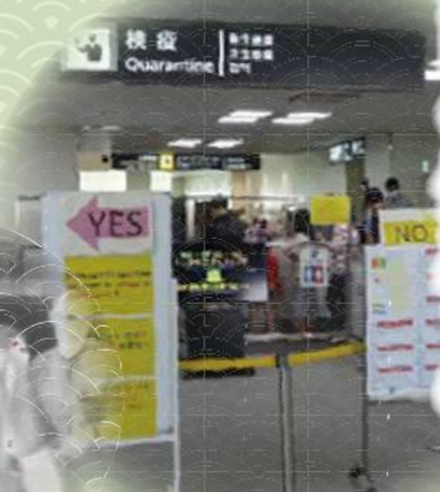
現在の検疫の様子 (発熱者をサーモグラフィーにて検知)