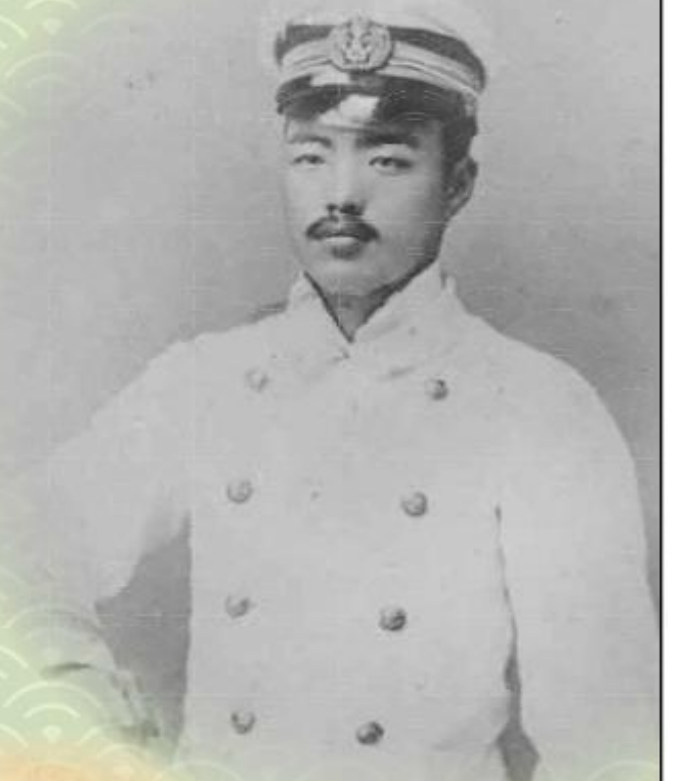
海港検疫医官補時代の野口英世