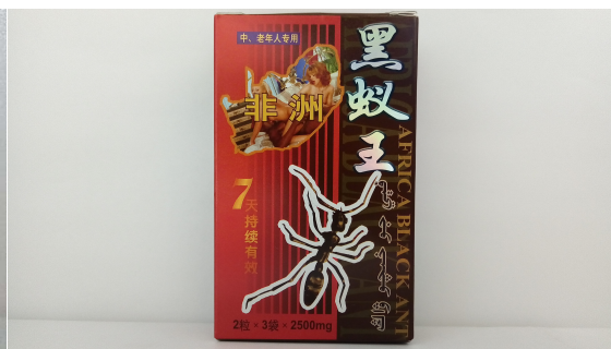
2 黒蟻王 1袋/6錠