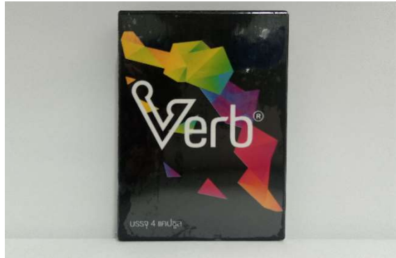
14 ベーヴ 4カプセル