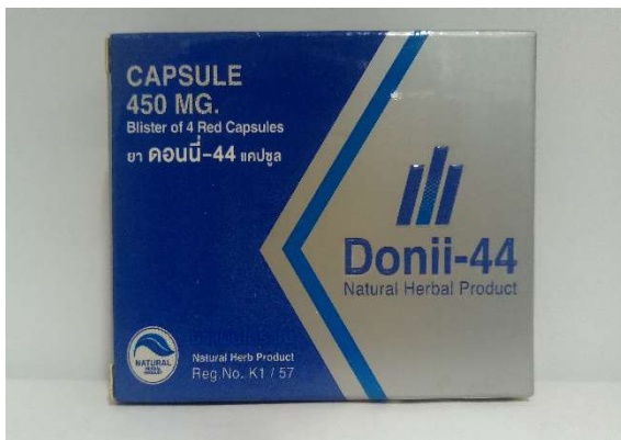
15、16 ドウニー44 4カプセル