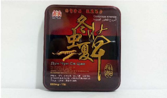
9 冬虫夏草 6800mg×10 粒/箱