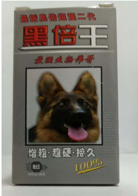
13 超強 黒倍王 10錠