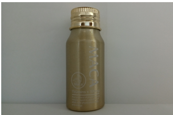
5 速効マカ（速効 MACA カプセル） 100mg*15カプセル/箱