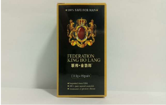
7 FEDERATION★聯邦.金勃郎 15 錠