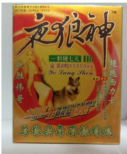
3 夜狼神 8カプセル