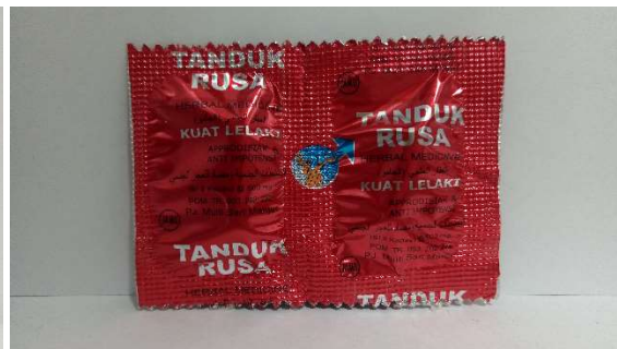
21 タンドゥクルサ 1袋2カプセル