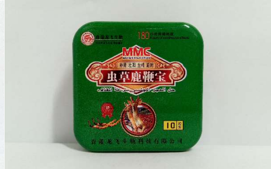
10 虫草鹿鞭寶 9800mg×10 粒/箱