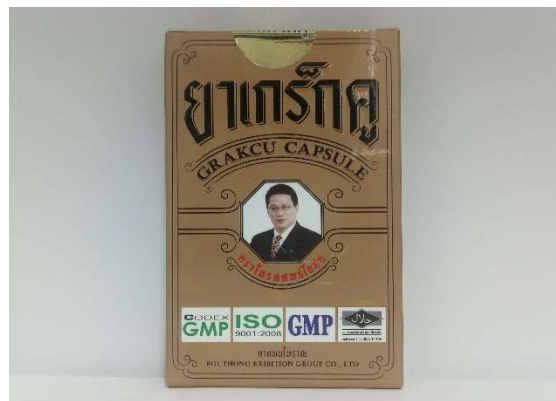
17 GRACU CAPSULE / グラック・カプセル 6カプセル