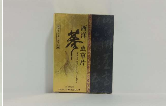
8 西洋参虫草片 0.6g×1 錠+蜜丸 1 粒/箱