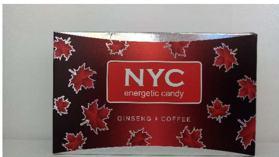
1 NYC 1箱 15粒