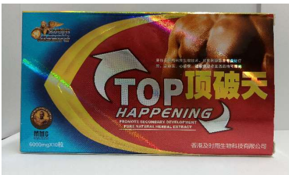
11 TOP 頂破天 10 錠