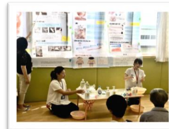
福井大学医学部附属病院