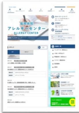
国立病院機構福岡病院