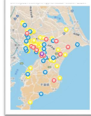
千葉大学医学部附属病院