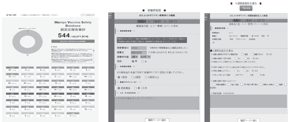
※ 8週間後副反応報告も同じ項目で調査