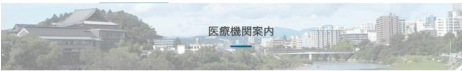
トップページ > 医療機関案内