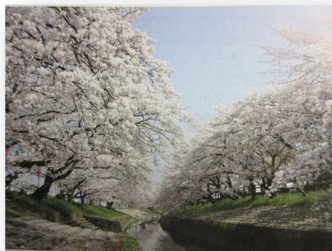
↑当市 高田川の千本桜

そして、あくまでも計画段階ではありますが「就労準備支援事業」の実施を目指しています。奈良県における各市の任意事業の実施率がかなり低かったため、事業の広域に向け、このたび、各市町村の財政事情、またそれぞれの苦悩、何度も何度も会って、話し合い、討論し、 広域実施実現化 の形をつくってきました。この計画に対し、土壌を作り、種を蒔き、みんなで肥料とたっぷりの水を加え、しっかりとした固い蕾が出来上がってきました。あとは、そっとゆるめるだけです。きっと大きな花を開かせますように・・・では、皆さま、これからは生活困窮者支援、私たち同志もみんなで支えあって頑張ってまいりましょう。