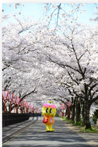
↑大和高田市のマスコットキャラクター「未来ちゃん～みくちゃん～」と千本桜

本市は、昭和23年年1月1日、県下2番目の市として市制を施行しました。奈良県の北西、大和盆地の南西にあり、全市域にわたり、ほぼ平坦な地形であります。南北に川が流れ、春になると多くの人が両岸に咲く千本桜の見物に訪れます。また、世界遺産の法隆寺、飛鳥時代の古代ロマンあふれる明日香村へも車で30分の至便な立地条件です。