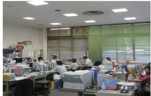
大和高田市くらし・せいかつ支援係の様子

生活困窮者自立支援制度の見直しに向けて平成29年5月から開催されている「社会保障審議会生活困窮者自立支援及び生活保護部会」は、12月11日に最終回（第11回）を迎えました。毎回設定される議題に関して委員の方々から御意見を頂き、白熱した議論が進められました。生活困窮者自立支援制度全般については、次のような観点から議論を行いました。