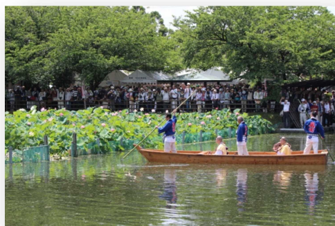
↑奈良県無形民俗文化財 奥田蓮取り行事

地勢的な面からみると、本市は大阪方面への通勤圏（本市主要駅から大阪市内まで、鉄道利用により約30分）に位置し、小規模住宅やマンションの建設も周辺地域に比して盛んな一方で、昔からの低家賃住宅や公営住宅も数多く存在しています。