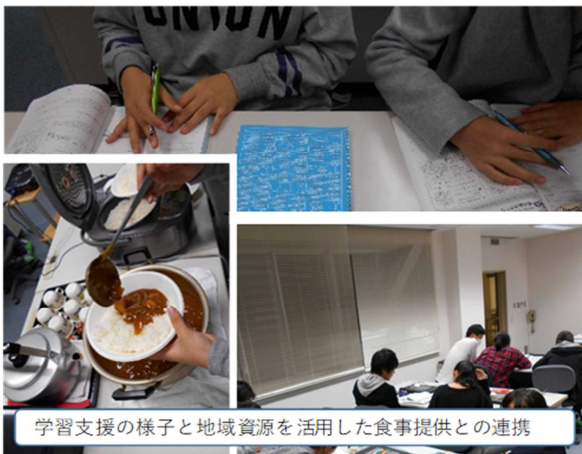
学習支援の様子と地域資源を活用した食事提供との連携

また、事業参加者には、卒業後も相談や報告に来てもらったり、今度は自身がスタッフとして参加し、後輩達に勉強を教える側に回ったりと、支援のつながりが途切れることなく、連鎖していくような場を目指しています。