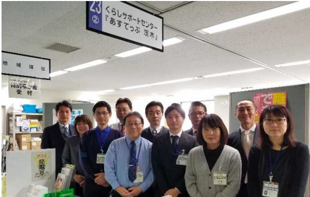
あすてっぶ茨木の皆さん