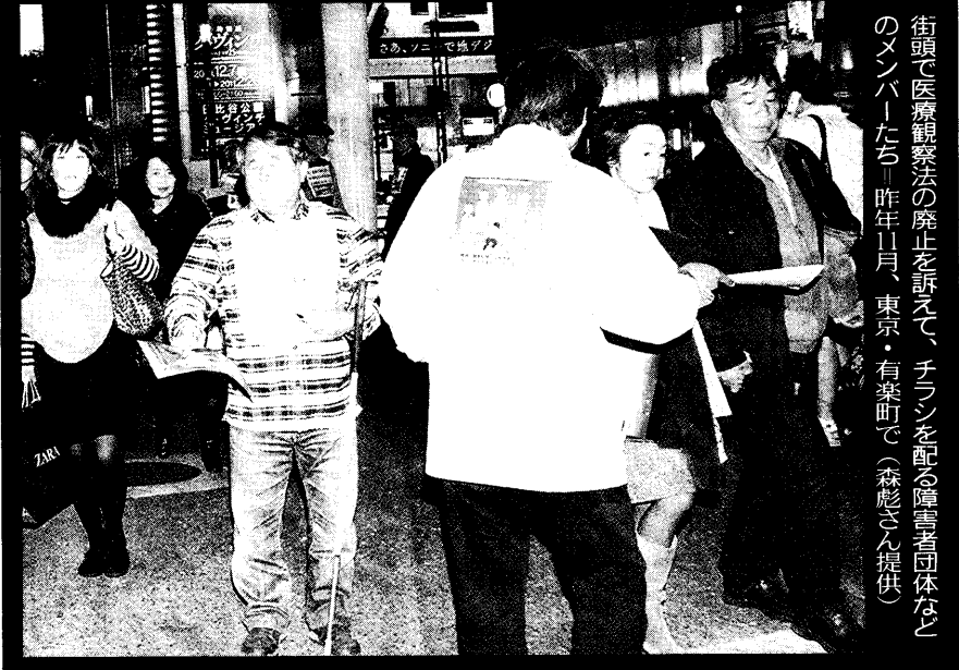
街頭で医療観察法の廃止を訴えて、チラシを配る障害者団体などのメンバーたち。昨年11月、東京・有楽町で

障害者の多くは「野放し」ではなく、事実上、強制入院されてきた。障害者の人権に詳しい池原毅和弁護士は「医療観察法の処遇を終えた人のうち、約四分の一が再び精神保健福祉法上の入院をしている。通院者も加えれば、四分の三に上る。精神保健福祉法に医療観察法を加えた意義がどこにあるのか、理解しがたい」と指摘する。